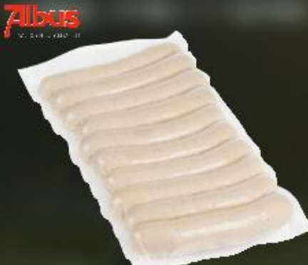
Feine Bratwurst 100 g Kaliber 30-32 mm

Art.-Nr.: 6617 Inhalt: 16 x 10 x 100 G 0,59 €/ST Allergene: keine