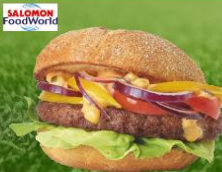
TK Rind Hamburger roh, Stück à ca. 135 g

Art.-Nr.: 135909 Inhalt: 1 x 6 KG 8,49 €/KG Allergene: Ei, G (Wz), M o.d.Z.*