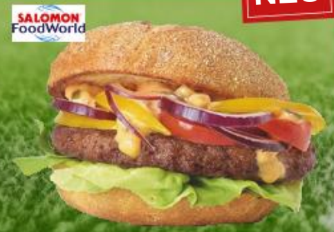
TK Rind Hamburger roh, gewürzt, Stück à ca. 180 g

Art.-Nr.: 135978 Inhalt: 4 x 2,5 KG 9,89 €/KG Allergene: keine o.d.Z.*