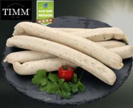
Geflügel Bratwurst mit Kräutern 100 g im ESC-Darm

Art.-Nr.: 6622 Inhalt: 6 x 20 x 100 G 7,99 €/KG Allergene: Sen