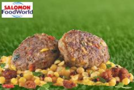
TK Rind Köfta gebraten Köfte Fleischbällchen, Stück à ca. 60 g

Art.-Nr.: 135909 Inhalt: 1 x 6 KG 8,49 €/KG Allergene: Ei, G (Wz), M o.d.Z.*