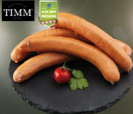
Krakauer Würstchen 100 g im Schweinedarm

Art.-Nr.: 6622 Inhalt: 6 x 20 x 100 G 7,99 €/KG Allergene: Sen