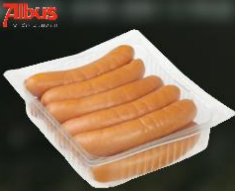
Bockwurst geräuchert 100 g im Schweinedarm

Art.-Nr.: 6599 Inhalt: 12 x 10 x 100 G 8,99 €/KG Allergene: keine